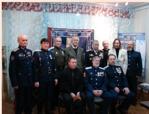
Фото на память (24 декабря 2012 года)

Прошу вас! - Обратите внимание на то, что за всю историю распространения ислама - были постоянно войны, революции и восстания!!!